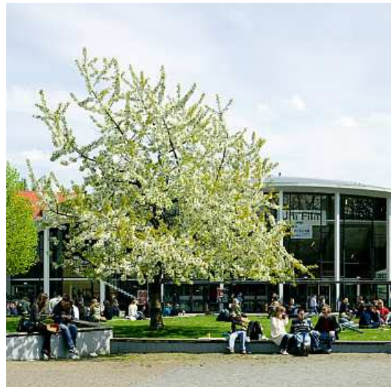
Universität Hamburg Von Melle Park