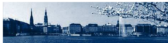
Blick über die Alster

Ja, es finden Klausuren in jedem Unterrichtsfach statt. Auch die mündliche Leistung im Propädeutikum wird bewertet.