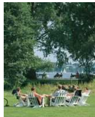
Sommer an der Außenalster

👍 Das Propädeutikum wird nicht auf die Regelstudienzeit angerechnet.